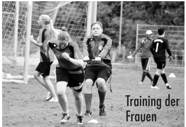
Training der Frauen